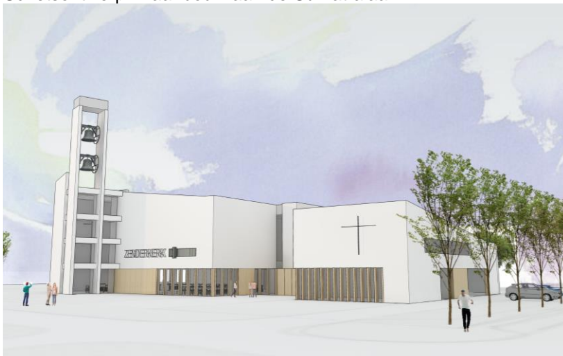
Schetsontwerp 1: aanbouw aan de Sumatralaan

Er zijn twee mogelijkheden van aanbouw gepresenteerd. Allereerst een aanbouw aan de zijde Sumatralaan, waar zich nu ook de zalen bevinden. De andere mogelijkheid is aan de zijde Hoeveweg. De inhoud van beide bijgebouwen is gelijk maar iets anders ingedeeld. De projectgroep heeft gemeend de focus op de tweede mogelijkheid te moeten leggen vanuit een financiële overweging: de vrijkomende grond waar nu de bijgebouwen op staan brengt meer op dan de grond aan de Hoeveweg. Wij verwijzen u graag naar de schetsen.