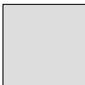
Vacant Bijstand in pastoraat